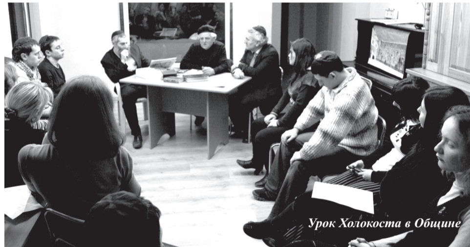
Урок Холокоста в Общине