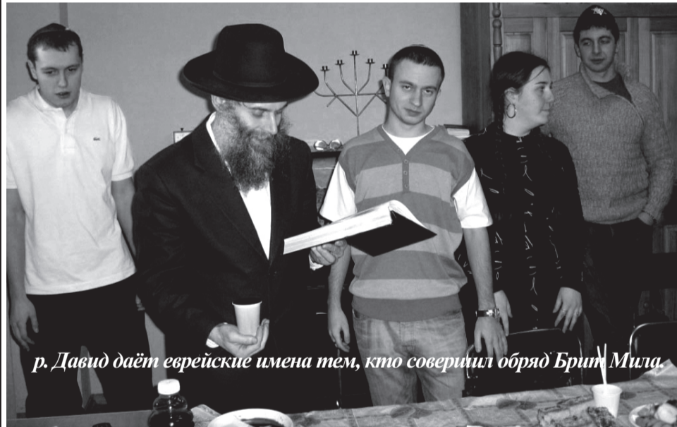
р. Давид даёт еврейские имена тем, кто совершил обряд Брит Мила.