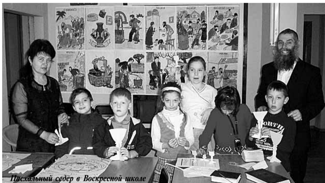
Пасхальный седер в Воскресной школе