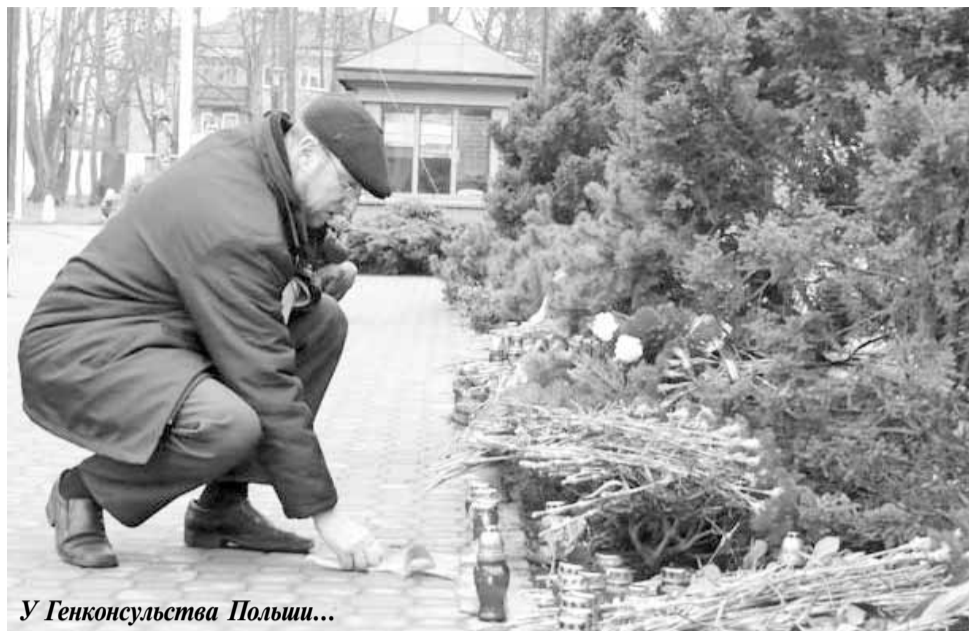
У Генконсульства Польши...