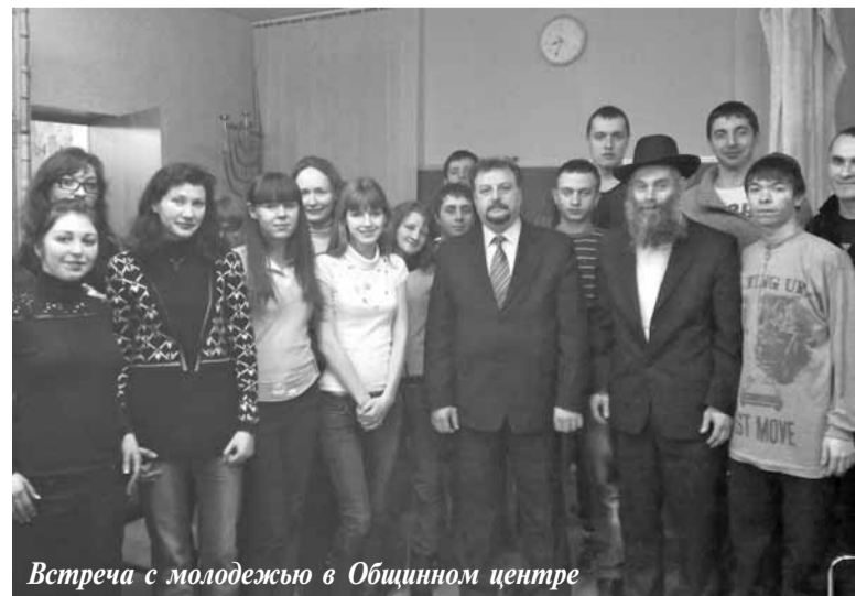
Встреча с молодежью в Общинном центре