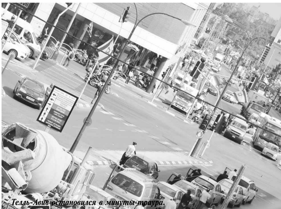
Тель-Авив остановился в минуты траура.

В этот день по всему Израилю звучит траурная сирена. На две минуты прекращается всякая деятельность, останавливается транспорт. Люди замирают в почтительном и скорбном молчании. Во многих домах зажигают поминальные свечи. В мемориальном музее "Яд ва-Шем" в Иерусалиме проходит официальная церемония поминовения жертв Катастрофы. Миллионы евреев, живущих в Израиле и за его пределами, читают в этот день заупокойную молитву Кадиш.