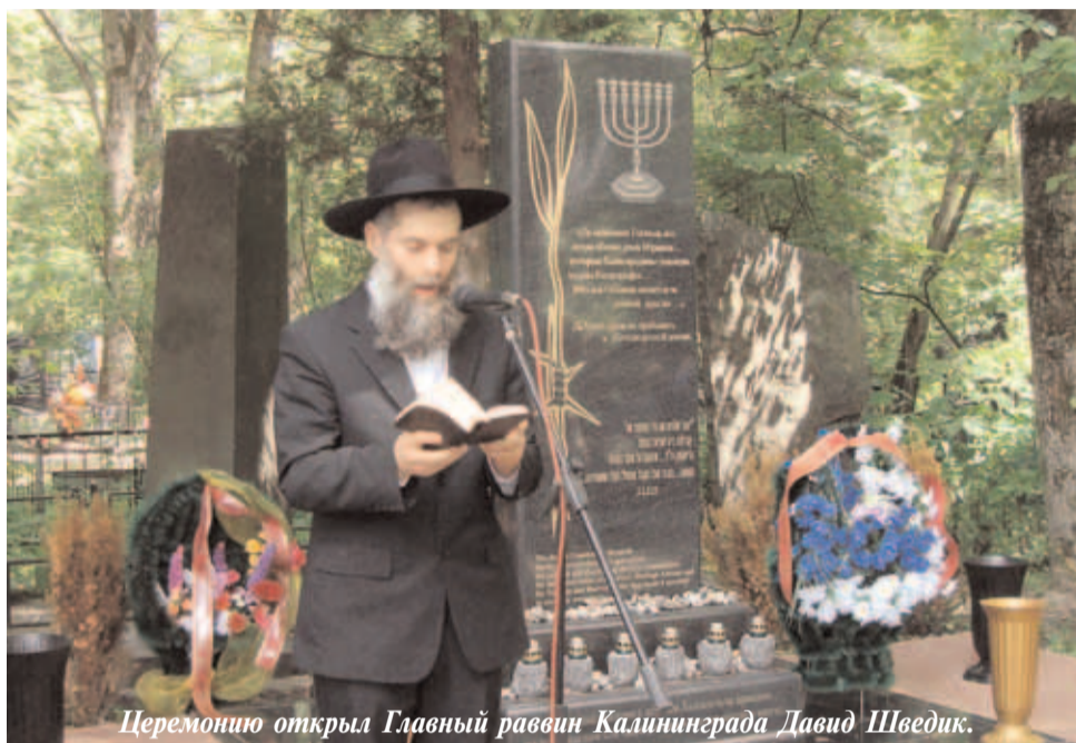
Церемонию открыл Главный раввин Калининграда Давид Шведик.

историка Ильи Альтмана на тему «Холокост в России» и специалиста Брянского государственного краеведческого музея на тему «Музеи Брянской области как методические центры по поиску и обустройству мест массовых захоронений жертв Холокоста», брянские учителя и краеведы поделились опытом поисковой и преподавательской деятельности по сохранению памяти о