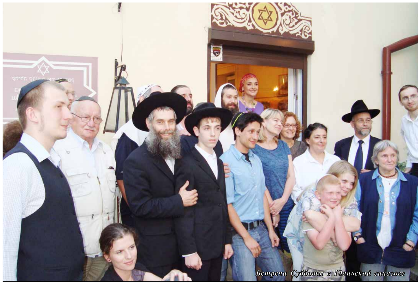
Встреча Субботы в Гданьской синагоге