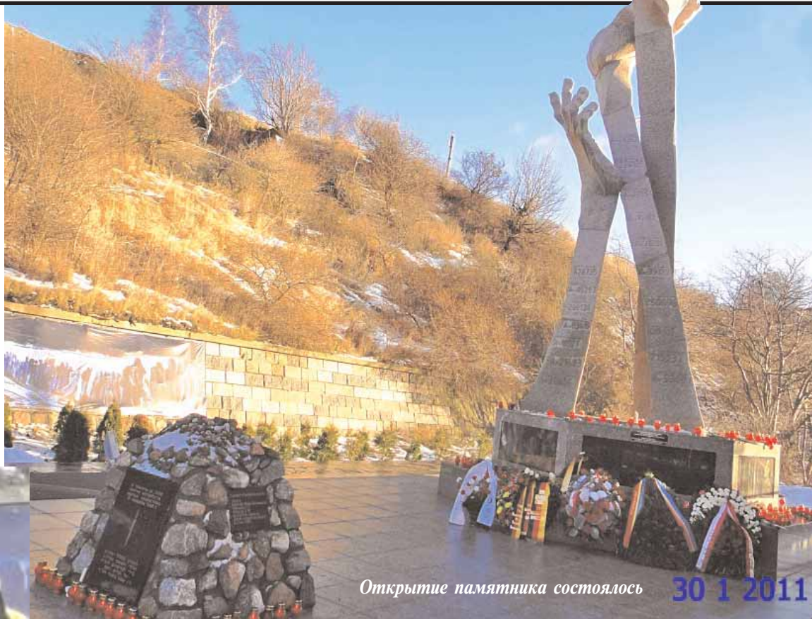
Открытие памятника состоялось 30.1.2011