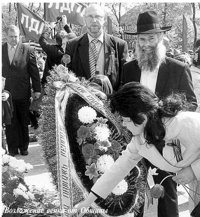
Возложение венка в Общине