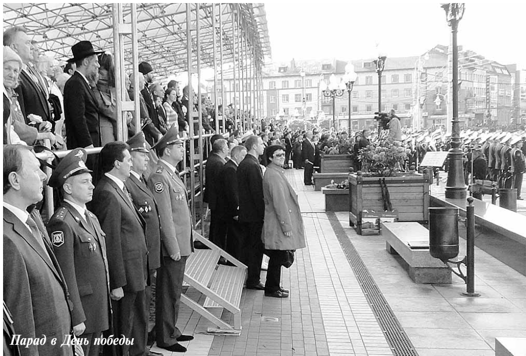
Парад в День победы