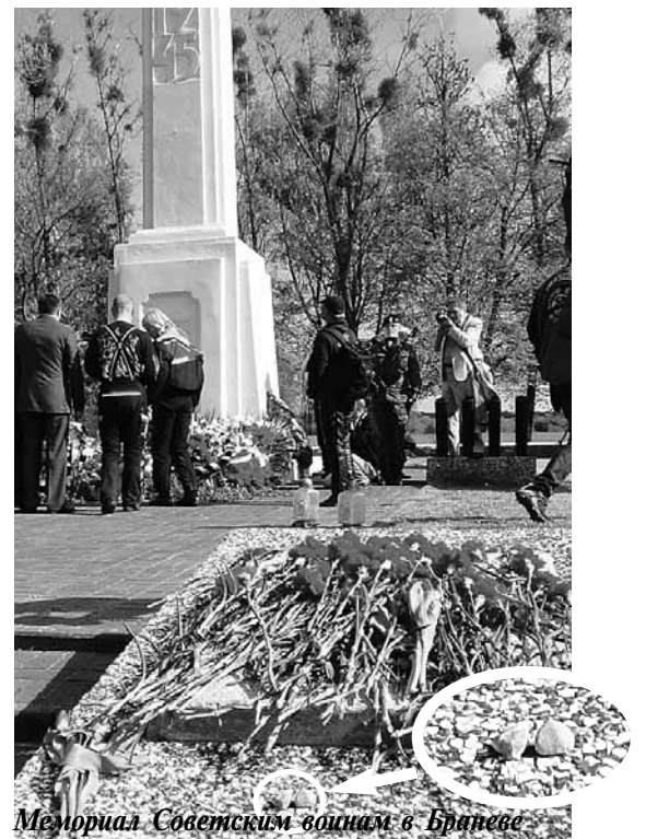
Мемориал Советским воинам в Бранево