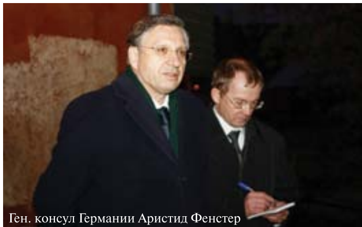
Ген. консул Германии Аристид Фенстер

9 ноября, в 18 часов калининградцы вновь собрались на траурный митинг у Памятной доски по ул. Октябрьской, 3 — уцелевшего сиротского дома на месте разрушенной синагоги (рядом с недавно заложённым Краеугольным камнем возрождаемой синагоги). Калининград — единственный город России, в котором случилась европейская трагедия, которая получила название погром Хрустальной ночи и где ежегодно отмечается этот траурный день.