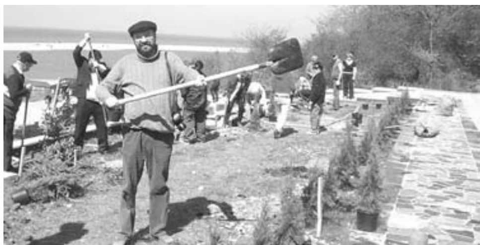
На Мемориале работа кипела.

Вначале все собрались около памятного камня погибшим на поминальную молитву. После чего все приступили к работе. А дело нашлось каждому, скучать не пришлось. Была убрана и сформирована территория, саженцы деревьев и декоративных кустарников стали ровно по-ниточке, засеян газон. К Мемориалу приходят организованные группы детей, как и в этот день. Интересуются историей. И наш общий труд послужил им хорошим жизненным уроком. После хорошей работы, кошерное