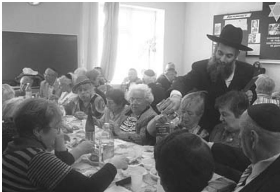
День Победы отметили традиционным угощением в общинном центре.