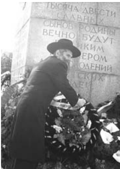
... от имени всей общины...