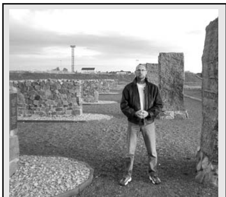
...видать, судьба такой!