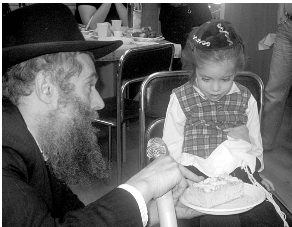
Опшерниш традиционно превратился в общинный праздник