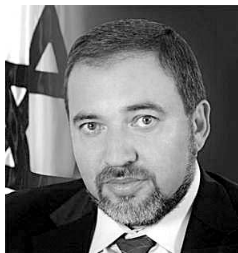
Министр иностранных дел Израиля Авигодор Либерман

На переговорах обсуждались темы дальнейшего развития российско-израильских отношений, иранской ядерной угрозы, важности влияния России на процесс мирного урегулирования на Ближнем Востоке. Затронув проблемы отношений с Европой и США, Либерман положительно отзывался о взаимодействии с российскими властями и лично главой МИД Сергеем Лавровым. По словам изра-