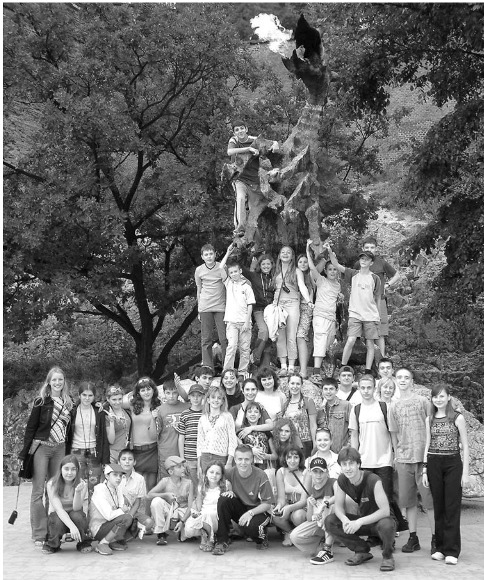
Калининградская группа перед мифическим драконом — символом Кракова

Особенность нашего геополитического положения подтолкнула калининградских евреев к "отделению от России". В то время, как российские группы формируются в Москве и едут поездом через Украину к венгерской границе (Ужгород - Чоп), калининградская группа добиралась до Сарваша автобусом через Краков. Двухдневный путь туда и обратно всегда был частью программы, и он был интереснее, чем до-