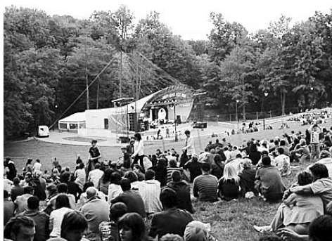
Три дня в Калининграде будет царствовать его Величество Джаз.

По информации пресс-службы городской администрации, с 31 июля по 2 августа в Центральном парке на сцене летнего театра пройдет четвертый международный музыкальный фестиваль "Дон Ченто Джаз". Как и в прошлые годы, он обещает стать самым ярким, веселым, интернациональным музыкальным событием летнего сезона в Калининграде. Три дня концертов на свежем воздухе, - демократичных и доступных для всех желающих (даже для тех, кто за билет не заплатил, но хочет быть рядом), - блестящие выступления и звездные имена.