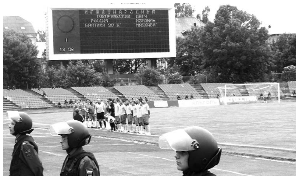
Перед матчем были предприняты беспрецедентные меры безопасности.